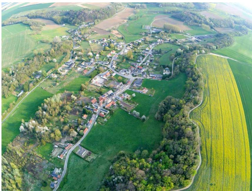
Photo-aérienne de Selens