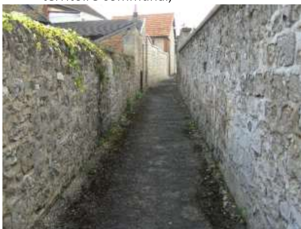
Sente rue de Broyon