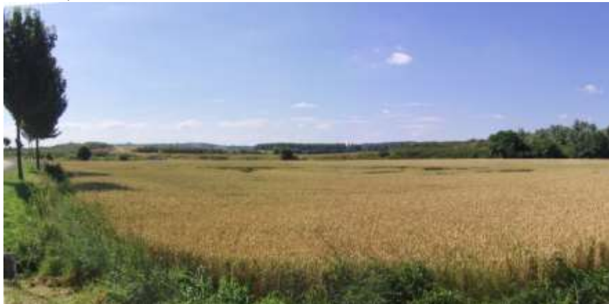
Les terres cultivées de la plaine