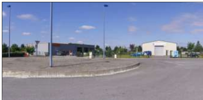
Zone activités de la Fosselle