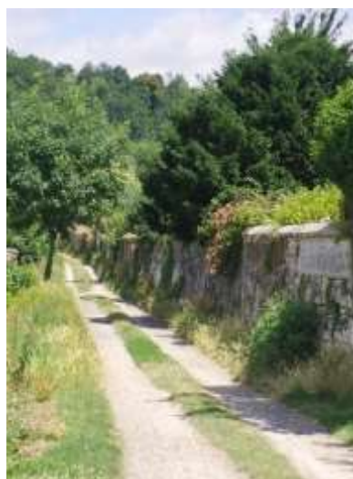
Sente de la Terrière

⇒ Prévoir la création de nouveaux équipements :