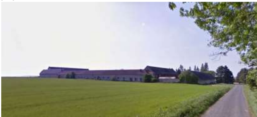
Les terres cultivées du plateau et l'ancienne ferme de la Montagne